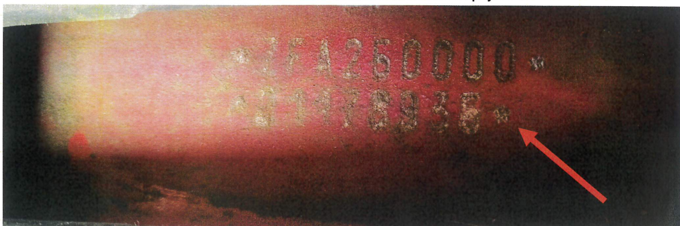
Fot. nr 2. Badania pojazdu – pole numerowe.