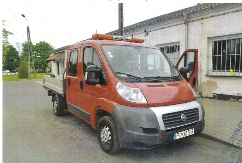
Fot. nr 3. Badania pojazdu.

Rzeczoznawca nr RS001163 ♦ bobrowskistefan@poczta.onet.pl ♦ tel. 602 139 377