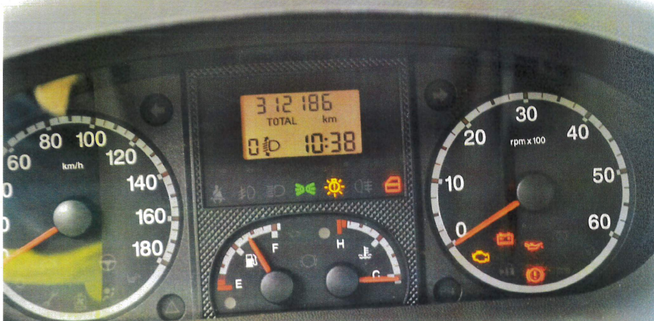
Fot. nr 7. Badania pojazdu-zapis drogomierza.