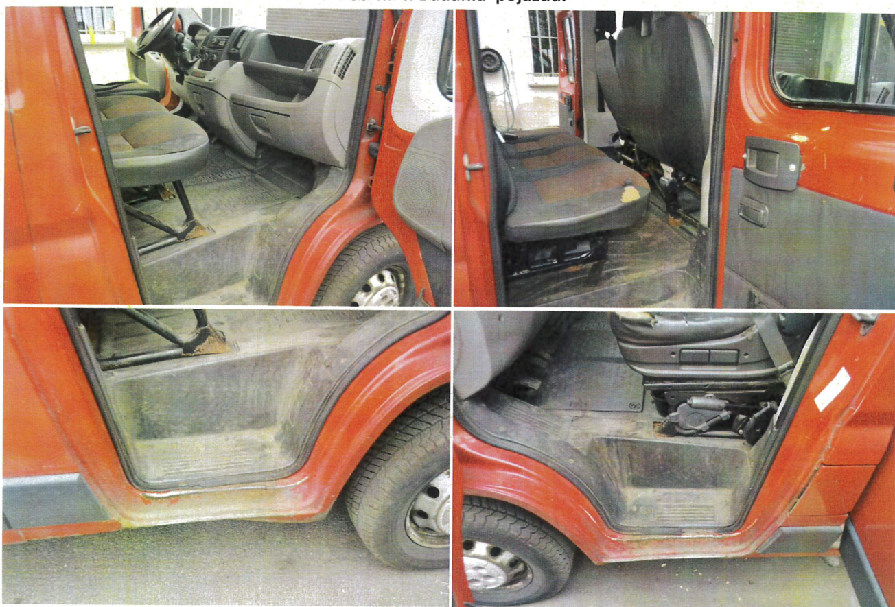
Fot. nr 5. Badania pojazdu.

RZECZOZNAWCA inż. STEFAN BOBROWSKI WPIS LISTA MINISTRA TRANSPORTU nr RS 001163 Rzecznik posiadający status Biegłego Sądowego - Biegłego Skarbowego Rzecznik Państwowej Inspekcji Handlowej nr VI-8/16