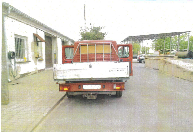
Fot. nr 4. Badania pojazdu.